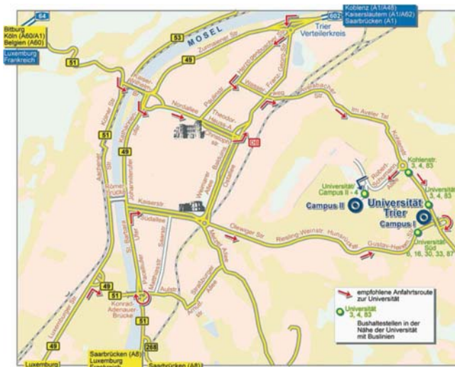
(Anfahrt zur Universität)